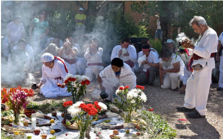
El cinturón de un venado